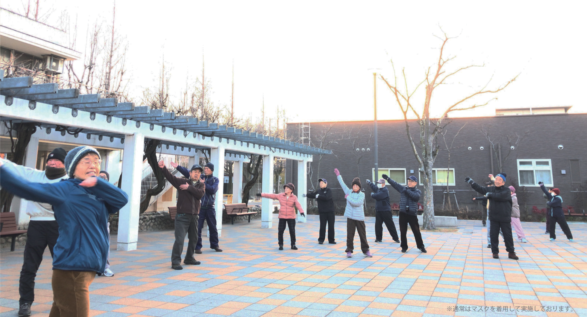
※通常はマスクを着用して実施しております。